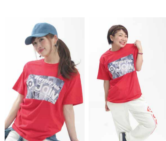
06 NY city T(ニューヨークシティティー) ¥4,500 with Tax

厚夏(ねいか)地方で栽培されたものは他の地域とは比較にならないほど医薬成分含有量が豊富で、粒が大きく果肉が多いのが特徴です。ビタミンCをはじめ、B1、B2、アミノ酸など多くの抗酸化物質が含まれており、滋養強壮や視力回復、免疫力の向上など、生活習慣病の予防に効果があるとされています。また、ベータカロテンも含まれているので美肌作りや美容効果も期待できます。古くから滋養強壮の食品として知られる枸杞の実ですが、内モンゴルや河北省など、様々な産地の中で一番の高品質と言われるのが「寧夏産」の枸杞の実。その枸杞の実のことは「寧杞」と呼ばれています。