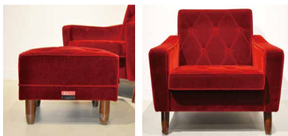
01 カリモク60 ロビーチェア1シーター ¥84,700+Tax オットマン ¥37,500+Tax

1968年の販売スタートより一度も廃番になることなく作り続けられているロングライフデザインのソファ。そんなロビーチェアを大須 DECO オリジナル仕様で製作。使用した張地は深みのある赤色のモケット生地「名古屋プレミアムモケットレッド」光の当たり具合によって色の濃淡が変わり、いろんな表情を見せてくれるソファになりました。同じ張地でオットマンも製作。こちらはロビーチェアの最高の相棒。普段は足を伸ばしてゆったりくつろぎ、来客があった際は補助椅子にもなるすぐれもの。