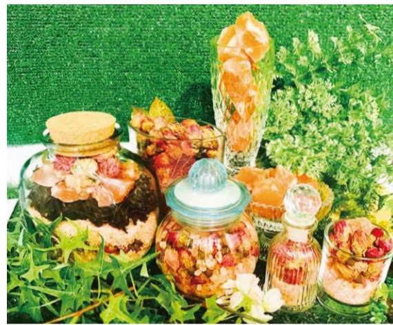
03 ヒーリングオブジェ ¥1,300 ~+Tax ※精油は別途

“あはれてふ ことをあまたに やらじとや 春におくれて ひとり咲くらむ” 解釈例：「あぁ、すばらしい」という褒め言葉を 他の多くの桜にやるまいと思って、 春が過ぎてから一本だけで咲いているのだろうか。 ※引用：『原文&現代語訳シリーズ古今和歌集』 桜の木をチャームリングに擬人化するこの歌からは、のびやかで穏やかで、温かい、『赤』。