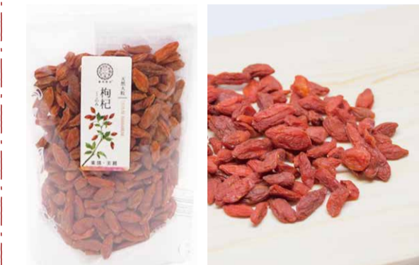
05 天然大粒 枸杞(クコ)の実

厚夏(ねいか)地方で栽培されたものは他の地域とは比較にならないほど医薬成分含有量が豊富で、粒が大きく果肉が多いのが特徴です。ビタミンCをはじめ、B1、B2、アミノ酸など多くの抗酸化物質が含まれており、滋養強壮や視力回復、免疫力の向上など、生活習慣病の予防に効果があるとされています。また、ベータカロテンも含まれているので美肌作りや美容効果も期待できます。古くから滋養強壮の食品として知られる枸杞の実ですが、内モンゴルや河北省など、様々な産地の中で一番の高品質と言われるのが「寧夏産」の枸杞の実。その枸杞の実のことは「寧杞」と呼ばれています。