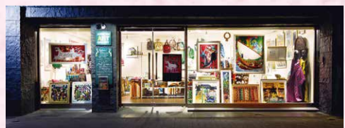
名古屋千種区東山通

タンザニアはキリマンジャロやセレンゲティなど知られていますが、素敵なアート・ティンガティンが故郷でもあります。その魅力を紹介するため愛知万博をきっかけに生まれました。グッズ販売の他、情報発信もしています。ぜひ一度お立ち寄りください。