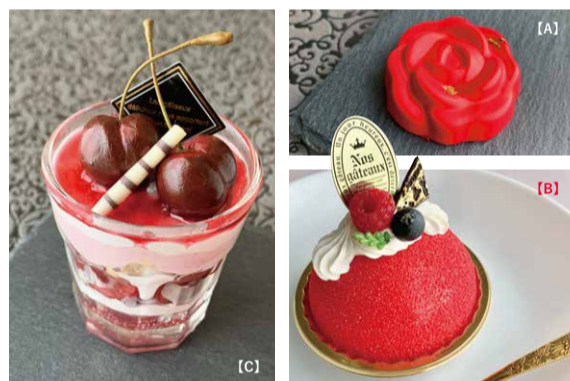
04 [A] ボンボンショコラ/NINA.sugarialale 5個セット ¥1,000 with Tax [B] 真っ赤なドームケーキ(メモスタンド)/NINA.sugarialale ¥3,000 with Tax [C] アメリカンチェリーのグラススイーツ(メモスタンド)/ヒロのフェイクスイーツカフェ ¥2,800 with Tax

浄化に良いと言われるヒマラヤ岩塩とドライハーブを使ったヒーリングオブジェ。 好きなアロマを垂らせば染み込んで香るので、リビング、寝室、玄関やおトイレに飾って、浄化にもなり、ほかに香るインテリアに♪ ■ヒマラヤ岩塩レッドソルト/ロックタイプ・粗目タイプ ■ドライハーブ/ミニローズ・アマランサス・ローゼル