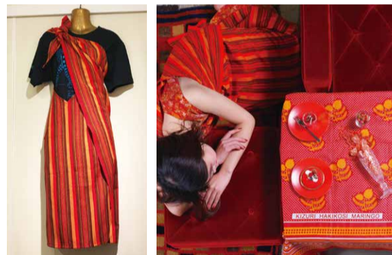
02 [左]オリジナル・マサイシュカ・エプロン ¥10,900+Tax [右]カンガ ¥2,800+Tax

型屋、土屋、窯元と美濃で陶器に携わる方々と協業して製作した新しい試みから生まれた食器。陶芸家の青木良太氏独自の釉薬と土のノウハウを信頼のおける工場と共有し、素材のディレクションをすることで、プロダクトに温かみのある音を吹き込むことができました。このプロジェクトが、美濃という産地を元気にするきっかけになれば、との想いがこもっています。