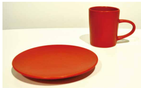
01 RYOTA AOKI POTTERY マグカップ SS のっぼ ローズレッド ¥3,200+Tax ポナベティ5プレート ローズレッド ¥2,300+Tax

型屋、土屋、窯元と美濃で陶器に携わる方々と協業して製作した新しい試みから生まれた食器。陶芸家の青木良太氏独自の釉薬と土のノウハウを信頼のおける工場と共有し、素材のディレクションをすることで、プロダクトに温かみのある音を吹き込むことができました。このプロジェクトが、美濃という産地を元気にするきっかけになれば、との想いがこもっています。