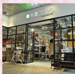
名古屋市中区 大須 DECO by SHIOGAMA APARTMENT STYLE

住所/〒463-6102 愛知県名古屋市中区平池町4-60-12 グローバルゲート2F 電話番号/11:00 - 20:00 定休日なし(年末年始を除く) メール/info@osuideco.com URL / http://www.osuideco.com そのほか情報/最寄り駅:あおみ緑ささしまライブ駅南名古屋駅徒歩5分圏内