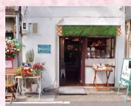
名古屋市中区大須