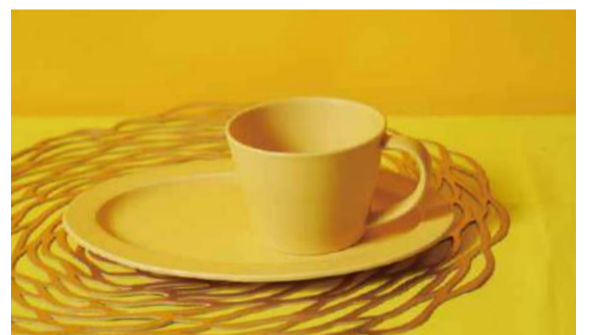
02 フラワーベース ¥3,080 with Tax コーヒーカップ ¥1,540 with Tax オーバル M ¥1,980 with Tax サラダボウル ¥3,080 with Tax

毎朝、シャツの色を選ぶようにお皿の色も選べたら。そんな想いで作った SAKUZAN DAYS Sara シリーズはさらっとしたマットな質感。手に触れたときの気持ちよさや唇になじむ縁の薄さも、きつと気に入っていただけるはず。毎日のお料理を作る時間も、食べる時間も空間も、もっと楽しくてすてきに色づくとうれしいです。朝食を明るく。おやつをエレガントに。うっわからコーディネートしてみる。カフェみたいなワンプレートディッシュも、好きな色で楽しめます。