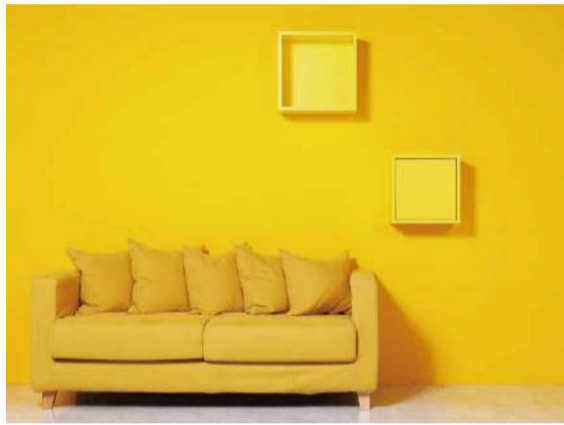
01 壁掛け棚 (扉なし) Aino WB7 A 単品 M PYE ¥8,000+Tax 壁掛け棚 (扉あり) Aino WB7-DX A 単品 S PYE ¥9,000+Tax

黄色は、不安があったり、懐疑心があったりして、心が緊張してしまっている場合、気持ちを和らげて、リラックスを促してくれます。そして、ユーモアや楽しい気持ちにさせてくれます。「明朗、希望、喜び、暖かさ、幸福、躍動、ユーモア、リラックス」の意味合いを意識し、何か新しいことを始めたり、前に進もうと決心した時は黄色を身の回りに取り入れると効果的かもしれませんね！